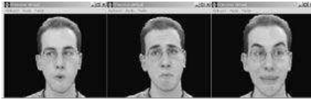
Figura 2: Aspecto del locutor virtual

2 se muestra el aspecto del locutor virtual en el que se va a integrar el nuevo sintetizador de voz.